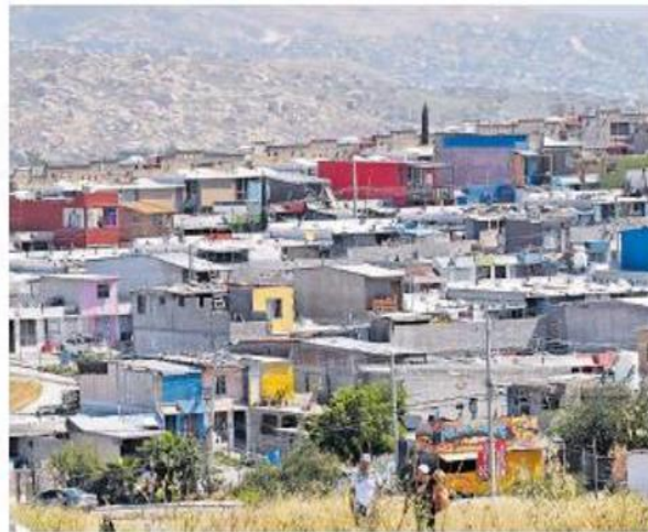
Es necesario que se incentive la producción de vivienda económica